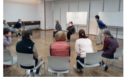
ヒント当てクイズ

コミュニケーションの促進や身体機能の維持を目的とする、ボール遊びなどのスポーツやゲームなどの活動 (例) ペタンク、お手玉での的あてゲームなど